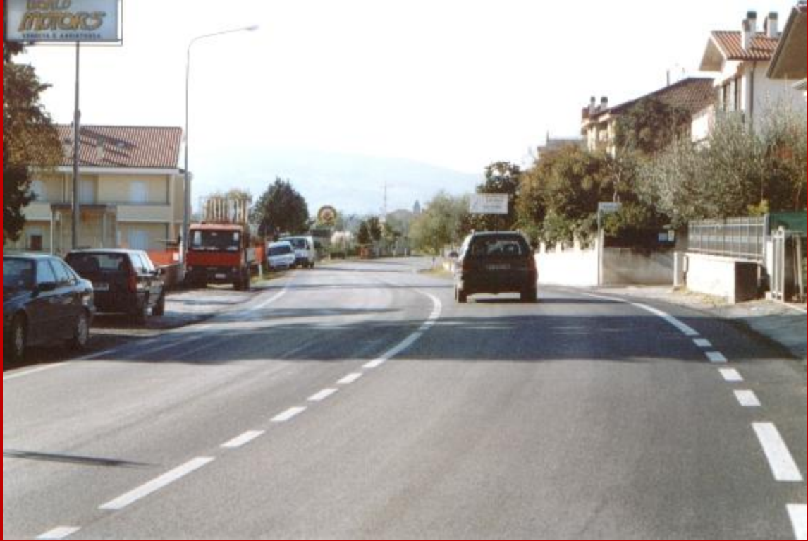
La strada all'inizio di Osteria Nuova