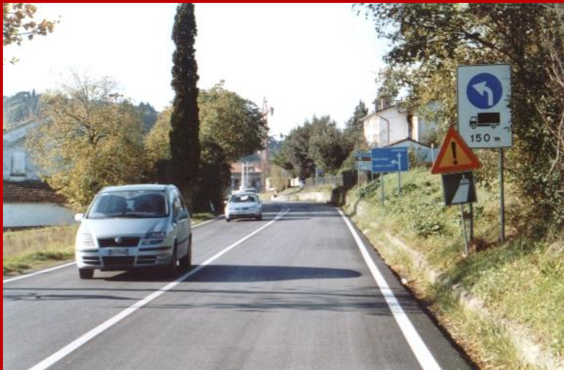
Tratto della strada tra Montecchio ed Osteria Nuova