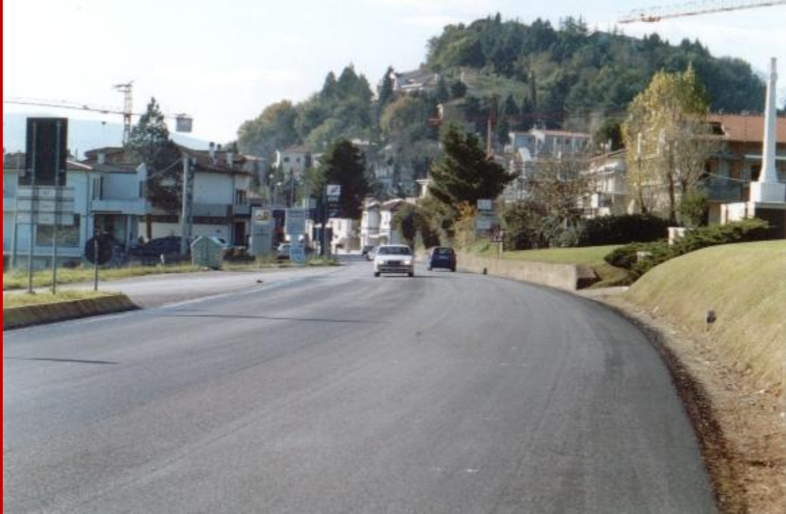
La strada nei pressi del cimitero di guerra poco fuori Montecchio all'altezza dell'attuale rotatoria all'incrocio con Via Arena