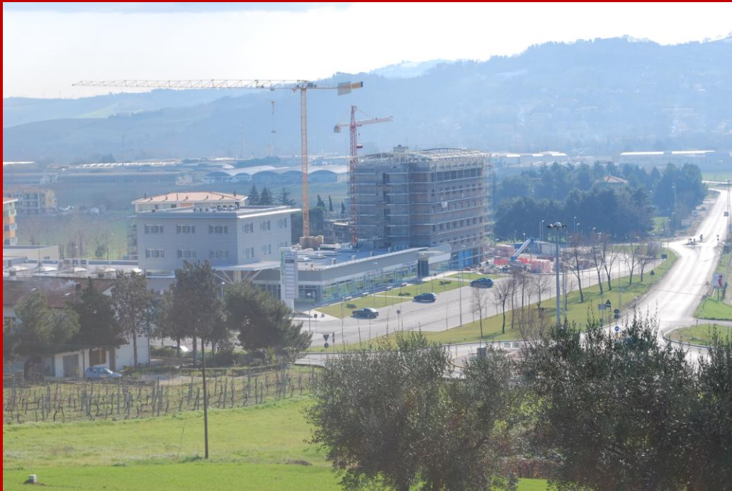
2009 il nuovo centro commerciale e l'hotel Blu Arena in costruzione. Sulla destra Via Arena