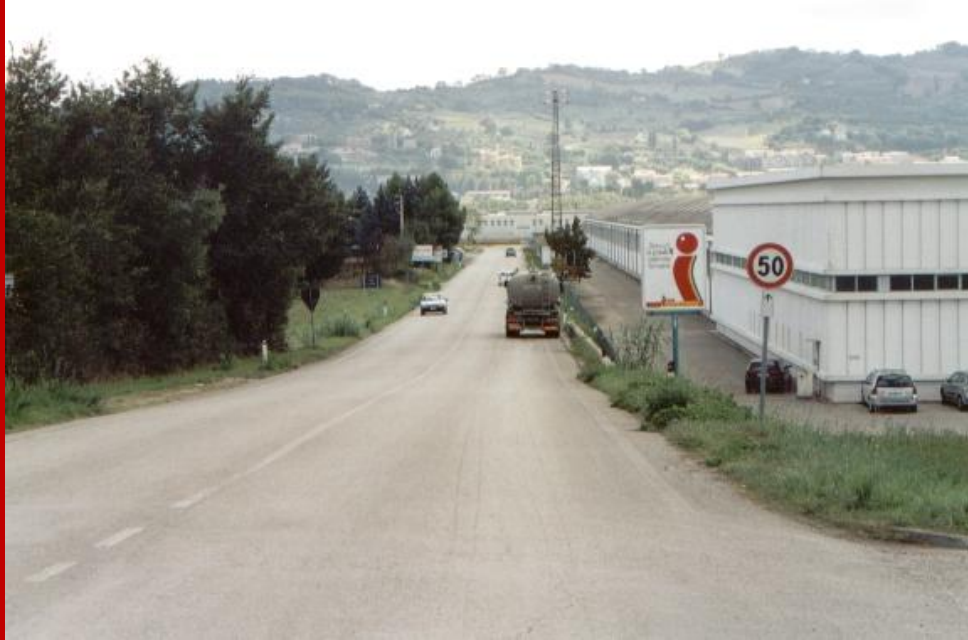
2005 Via Arena (sulla sinistra della foto oggi sorge il centro commerciale e l'hotel "Blu Arena")