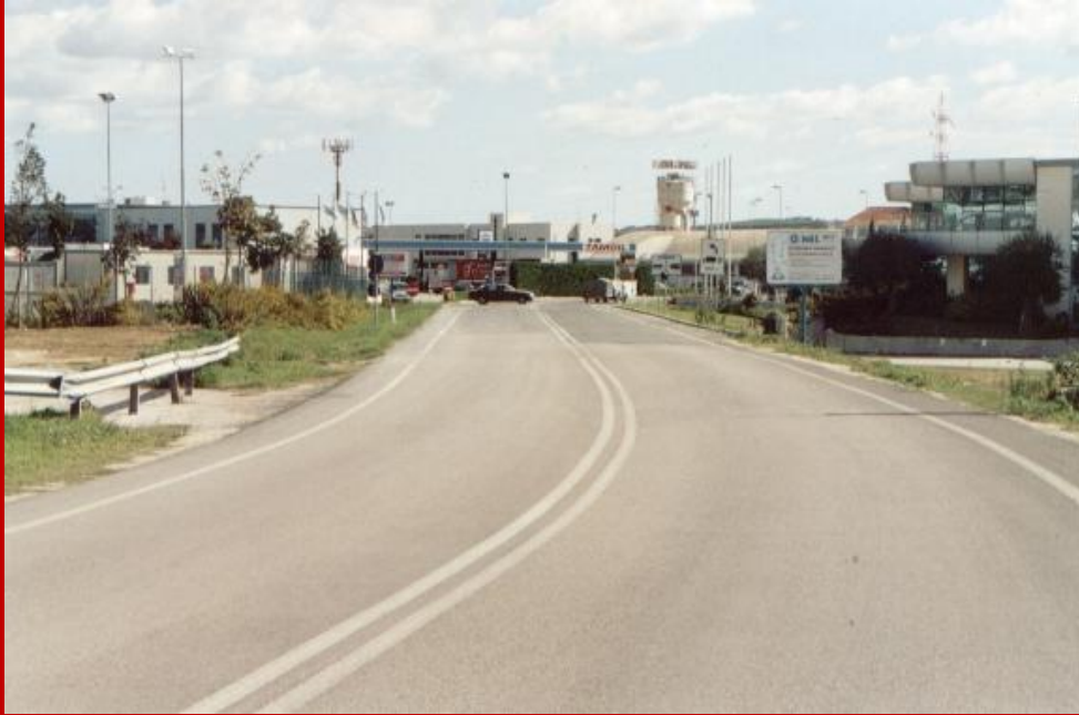
2005 Via Arena nel cuore dell'area industriale