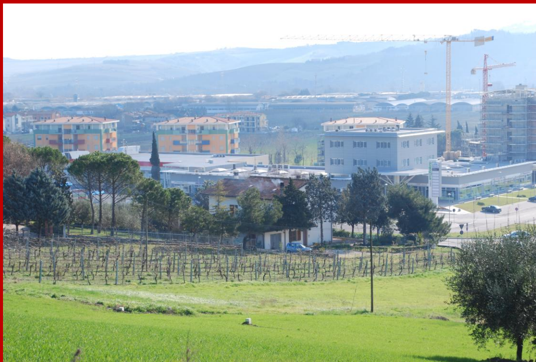
2009 Il nuovo centro commerciale in costruzione