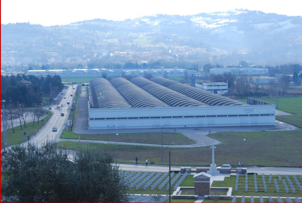
2009 A destra di Via Arena il grande capannone Corsini e in primissimo piano parte del cimitero di guerra canadese