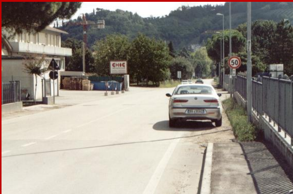
2005 Via Arena nei pressi del ponte sul fiume Foglia