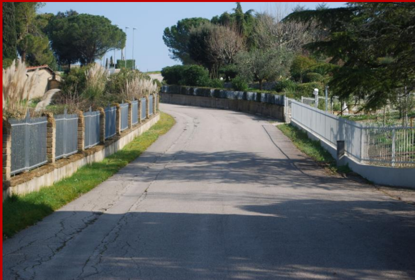
Via del monte 2014

Via del monte è una strada secondaria che si diparte da Via del Re dei gatti e si inoltra nella campagna sulle pendici del monte di Montecchio. Come è naturale si tratta di una via tranquilla, con poco traffico se non quello dei residenti. Chiaramente il suo nome è legato al monte stesso.