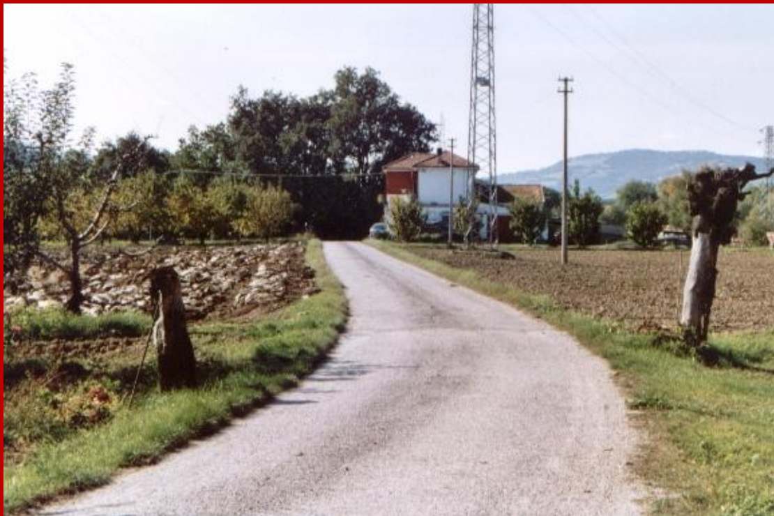
2005 Via Fiume

Via Fiume è una strada secondaria di campagna che termina nei pressi della sponda sinistra del fiume Foglia. Si tratta praticamente di una strada chiusa al servizio solamente di qualche famiglia che abita nei suoi pressi.