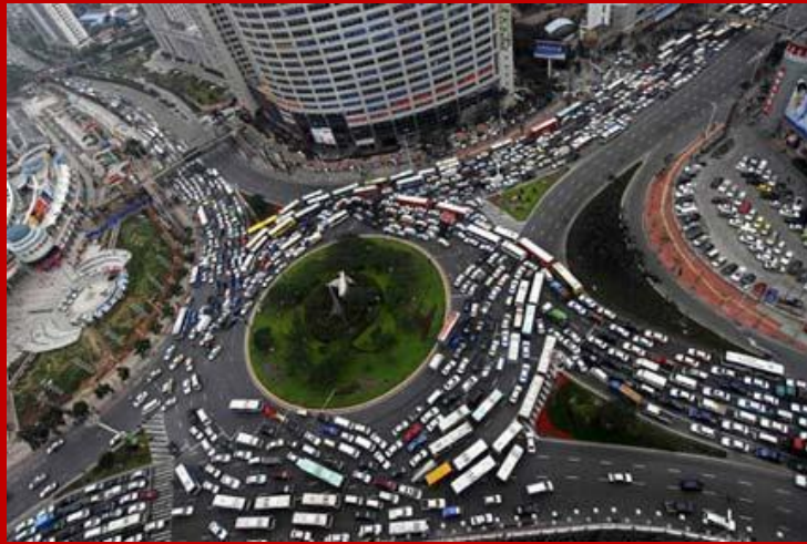
Palermo Piazza Indipendenza