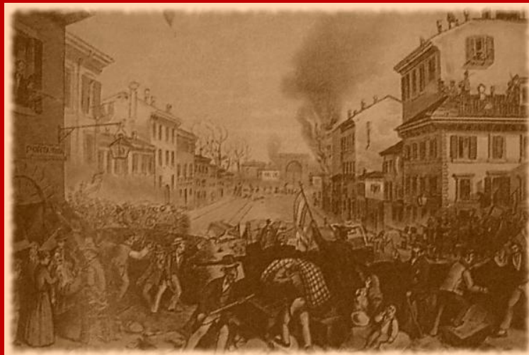
Prima guerra d'indipendenza