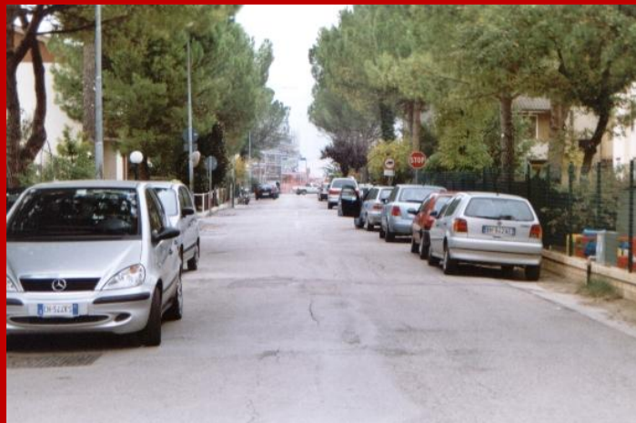
2005 Via Indipendenza

Via Indipendenza unisce Via Amendola alla nuova Via Mamelì, aperta da poco tempo. E' parallela a Via XXV Aprile e attraversa una nuova lottizzazione anch'essa sorta da poco.