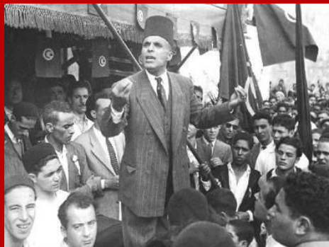
1956 Indipendenza Tunisina

Riportiamo alcune immagini che illustrano questo aspetto della vita di un popolo.