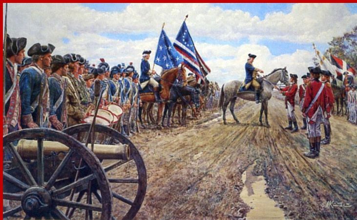
Guerra indipendenza americana