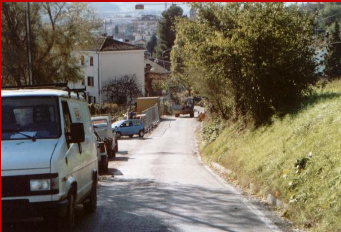
2005 Via Redipuglia