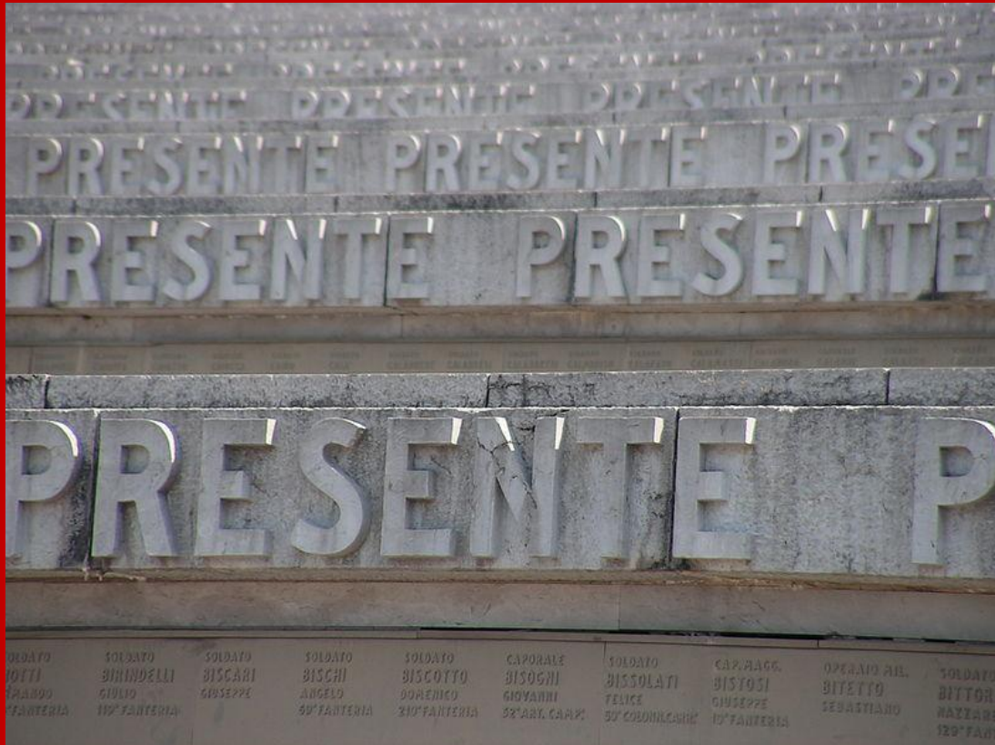
Dettaglio dei gradoni