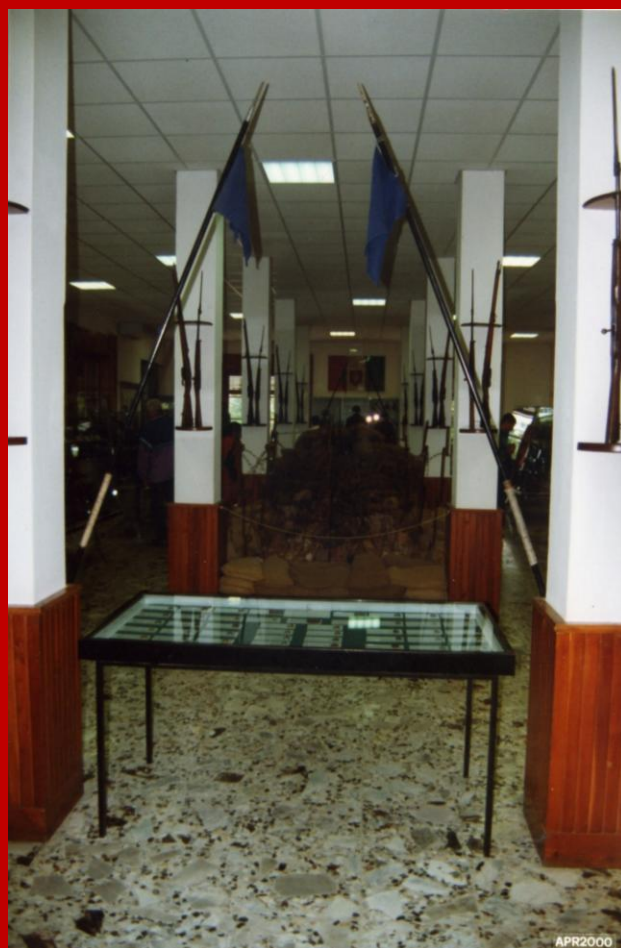
2000 Ingresso al Museo

Note tratte da Wikipedia l'enciclopedia libera