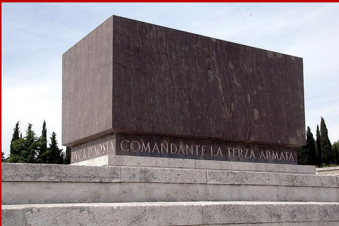
La tomba del Duca d'Aosta

In concomitanza con l'edificazione del sacrario fu realizzata anche la stazione di Redipuglia, da inquadrarsi nell'ottica di monumentalizzazione della zona di Redipuglia.