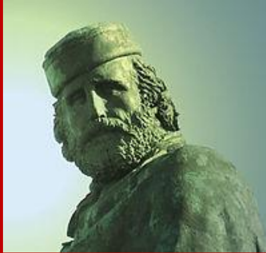
Roma, Gianicolo: Monumento a Giuseppe Garibaldi