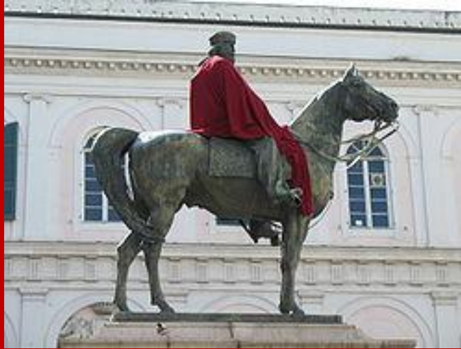
Genova, monumento equestre a Giuseppe Garibaldi

Nominato generale del governo milanese, con un gruppo di volontari si batté a Luino (15 agosto), conquistò Varese, resistette a Morazzone (26 agosto); ridotte le sue forze a poche centinaia di uomini dovette sconfinare in Svizzera. Nel moto di indipendenza nazionale, Garibaldi ebbe il grandissimo merito di far entrare il popolo nel Risorgimento, valendosi del suo fascino, delle sue straordinarie qualità guerriere e della sua generosità. L'estensione dell'ambiente rivoluzionario e patriottico, attraverso il volontarismo garibaldino, rese infatti possibile una più vasta e risolutiva azione, portando un elemento nuovo nel moto unitario, il contributo del popolo. Furono il fermento rivoluzionario, l'entusiasmo combattivo dei volontari, il coraggio popolare che a Roma, durante la Repubblica del 1849, galvanizzarono la resistenza e fecero della convulsa, cruenta campagna, come scrisse Mameli, una pagina "veramente romana nella storia d'Italia". L'aspra battaglia di San Pancrazio e la difesa di Roma (3 giugno- 1 luglio 1849) mettono in una luce particolare le doti militari di Garibaldi che qualche storico straniero considera il più grande generale italiano fino ai nostri tempi. Caduta la Repubblica egli abbandonò la città con pochi fedeli e si rifugiò a San Marino, eludendo la sorveglianza di quattro eserciti; imbarcatosi a Cesena dovette sbarcare a Magnavacca ( ora Porto Garibaldi) dove gli morì la moglie Anita.