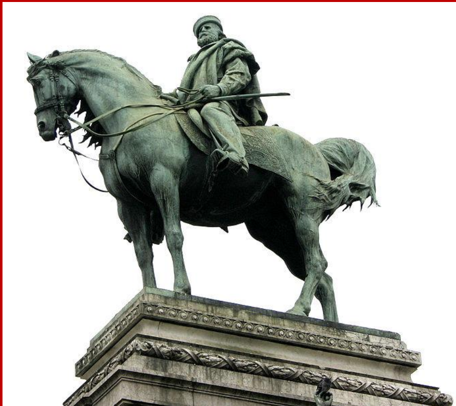
Milano, Piazzale Cairoli

rendeva “straniero in Patria”. Accettato il comando dell’esercito toscano, offertogli dal Ricasoli, passò nell’Italia centrale per invadere lo Stato Pontificio e prendere la direzione della rivolta. Ma il timore di una reazione francese convinse Vittorio Emanuele a far dissuadere Garibaldi dall’impresa. Ritornato a Nizza Lanciò un proclama che aspramente attaccava la politica piemontese e domandava agli Italiani la sottoscrizione di un milione di fucili per la nazione armata, rivendicando al re la sua libertà di azione. Fu il primo contrasto tra Garibaldi ed il re, l’uno subordinando l’azione alla politica interna, l’altro a quella internazionale. Pervenutagli notizia dei moti palermitani (aprile 1860), dopo aver chiesto l’aiuto regio, raccolto un corpo di volontari, tra incertezze ed esitazioni, Garibaldi salpò il 5 maggio da Quarto. Rapidità, audacia e durezza furono i capisaldi della sua azione nella spedizione le cui tappe furono Marsala, Calatafimi, Palermo, Milazzo, Messina, Reggio, mentre le province meridionali insorgevano l’una dopo l’altra.