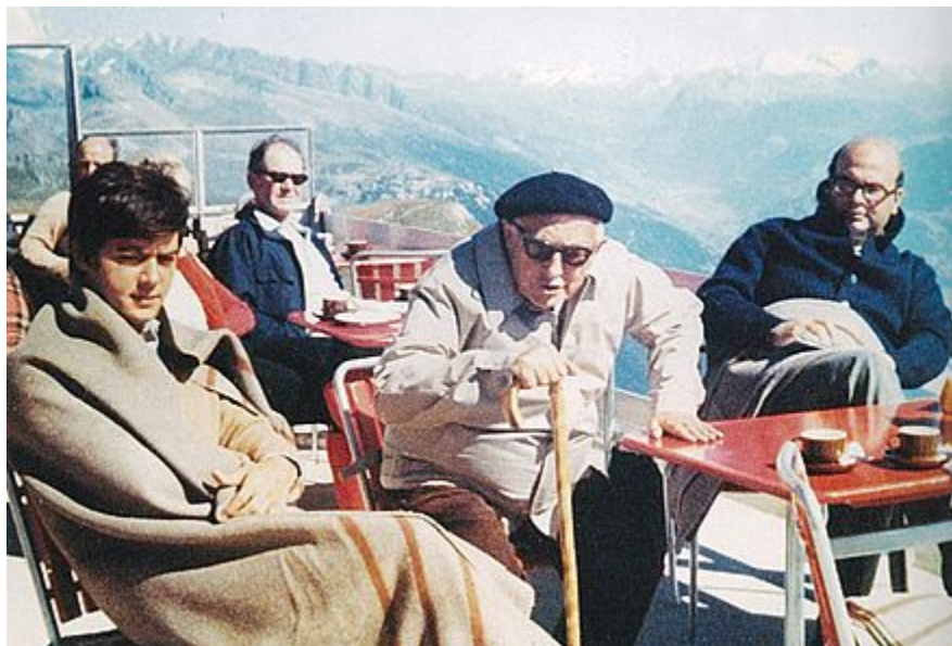
Nenni con Claudio Martelli e Bettino Craxi nel 1972 a Crans-sur-Sierre (tratto dal libro “Ricordati di vivere” di Claudio Martelli, Bompiani)

Perché un rebus? In Svezia una saturazione di benessere porta al rigetto - temporaneo - del governo socialista che a tutto provvede tosando i cittadini con le tasse. In Cile le casalinghe che scendono in strada tambureggiando con le pentole e i camionisti che bloccano i trasporti aprono la strada al golpe militare. Dov'è il rebus? Il rebus esiste solo se si parte dall'idea che il socialismo sia la soluzione adatta sempre e comunque (o, all'opposto, che non lo sia mai), che, diversamente da tutte le aspirazioni e le realizzazioni umane non sia contingente ma debba essere definitivo e non solo per metà della popolazione. Qui, in questo scivolamento quasi inconscio dalla politica nell'utopia salvifica si rivela la particolarità di Nenni. Nel corso di una quasi secolare esperienza politica il patriarca del socialismo italiano con la sua